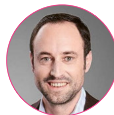
Christian Wasserfallen, Nationalrat Bern