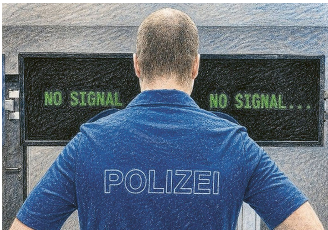
Verliert den Durchblick: die Polizei.

Illustrationen mit Unterstützung von KI erstellt.