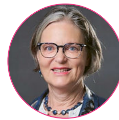
Helen Freiermuth, Präsidentin FDP International

Die Initiative «Keine 10-Millionen-Schweiz!» (Nachhaltigkeits-Initiative) beschäftigt auch die Auslandschweizerorganisation und stand an der Frühlingssitzung des Auslandschweizerzerrats, ihres höchsten Organs, prominent auf der Traktandenliste. Im Hinblick auf die gravierenden Konsequenzen für die Auslandschweizer erfolgte der Aufruf zur Ablehnung der Initiative klar.