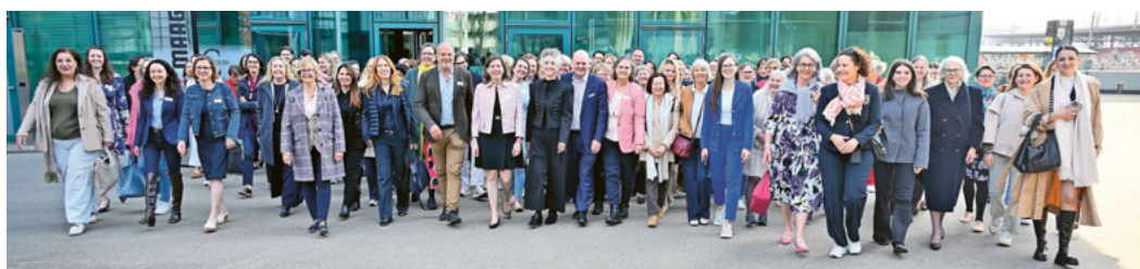
Über 100 Frauen, die bereits Spuren hinterlassen haben: ein herzliches Dankeschön an all unsere Mitglieder. Gemeinsam gehen wir die nächsten Schritte und freuen uns auf alles, was kommt.