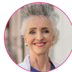
Carmen Walker Späh, Regierungsratspräsidentin

Kurzfristig gibt es drei wohnpolitische Volksabstimmungen, die der Regierungsrat und der Kantonsrat gewinnen wollen. Darüber hinaus ist die Verkehrspolitik eine grosse Priorität. Der Bundesrat legt in Kürze den Entwurf für Verkehr '45 vor. Da liegt einiges im Argen. Was umso kritischer ist, weil es um sehr viel Geld geht. Und wenn Sie nach dem Vermächtnis fragen – darüber mache ich mir keine Gedanken. Aber wer weiss, vielleicht gibt es im Innovationspark ja dereinst eine kleine Plakette, auf der mein Name steht.